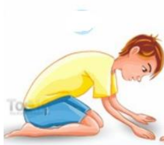
מנח גוף קיפוד