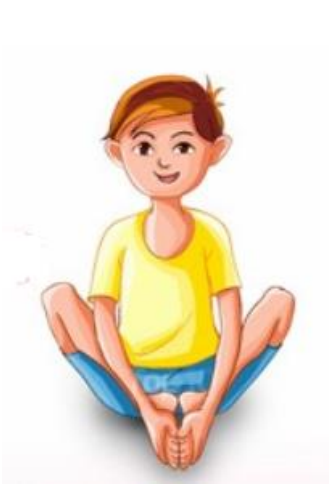
מנח גוף פרפר