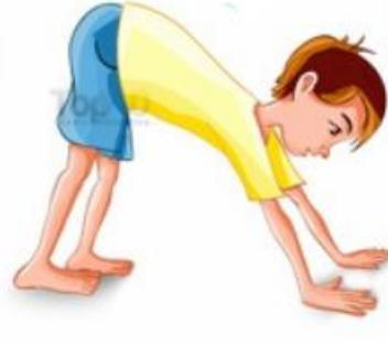
מנח גוף כלב