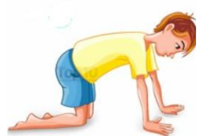
מנח גוף חתול