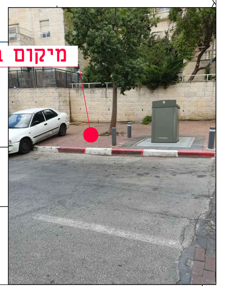
מיקום במפרץ מדרכה