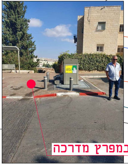
מיקום במפרץ מדרכה

הערות: • גבולות השיקום ייקבעו ע"י המפקח בשטח בשלב הביצוע, לאחר החפירה והצבת מעטפת הבטון. • אין לבצע עבי שיקום לגבולות הביצוע הנחיות מפורטות לגבולות הביצוע. • ביצוע ע"פ חוברת פרטים סטנדרטיים וקביעת המפקח לסוג הפרט. עבור עבודות גמר בלבד. • ביצוע התקנת הפז על פי תכנון ביצוע הספק, התאמת כל המידות הנדרשות לביצוע הפז ולקבלת שיקום סופי בהתאם לפרט המתכנן - באחריות הספק.