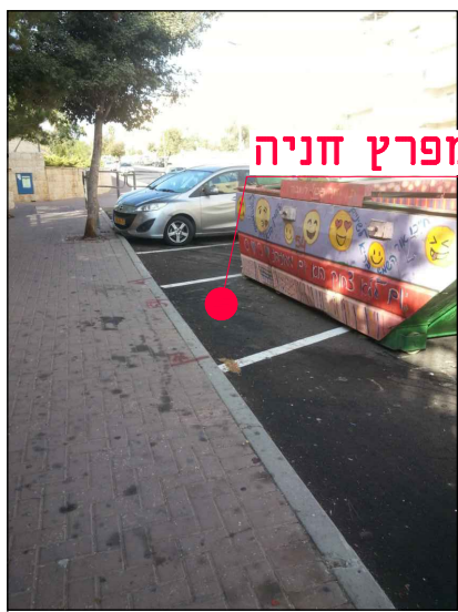
מיקום במפרץ חניה

נושא השרטוט: תנוחה קנ"מ: 1:100 מס' תיק תאום: 803678 שם קובץ הגיונות: MOR-BIN-JER-PISGZEEV_MZR-FC-20XX.DWG שם קובץ הדפסה: MOR-BIN-JER-PISGZEEV_MZR-FC-2054a-00.PLT מהדורה גיליון שלב פרוייקט אילמנט מקום תחום ספק MOR-BIN-JER-PISGZEEV-FC-2054a-00