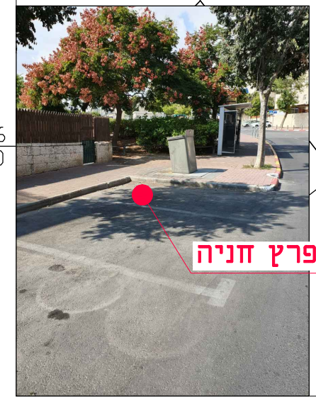
מיקום במפרץ חניה