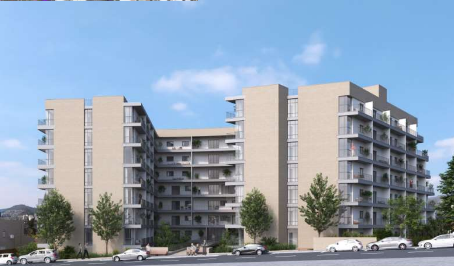
חזית לרחוב יוספטל