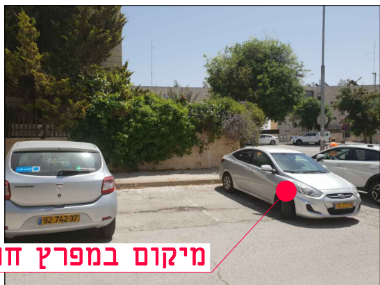
מיקום במפרץ חניה

מחזור גיליון שלב פרויקט אלמנט מקום תחום ספק MOR-BIN-JER-PISGATZEEV_B-FC-2014-00