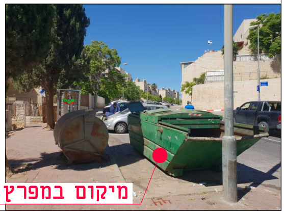
מיקום במפרץ חניה