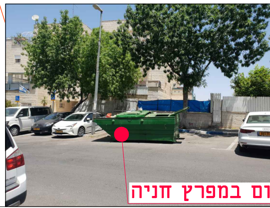
מיקום במפרץ חניה

הערות: • גבולות השיקום ייקבעו ע"י המפקח בשטח בשלב הביצוע, לאחר החפירה והצבת מעטפת הבסון. • אין לבצע עבי שיקום ללא קבלת הנחיות מפורטות לגבולות הביצוע. • ביצוע ע"פ חוברת פרטים סטנדרטיים וקביעת המפקח לסוג הפרט. עבור עבודות גמר בלבד. • ביצוע התקנת הפז על פי תכנון ביצוע הספק, התאמת כל המידות הנדרשות לביצוע הפז ולקבלת שיקום סופי בהתאם לפרט המתכנן - באחריות הספק.