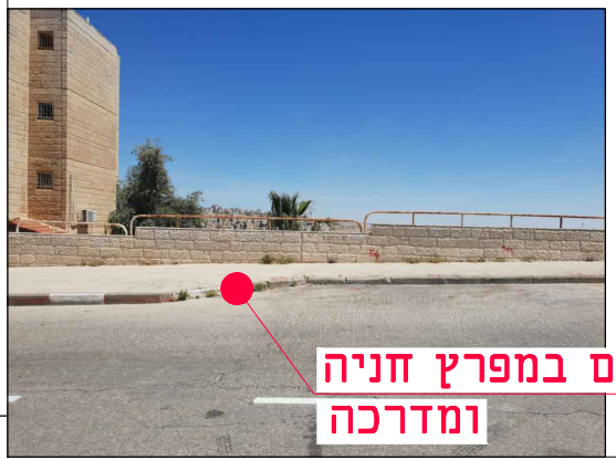
מיקום במפרץ חניה ומדרכה