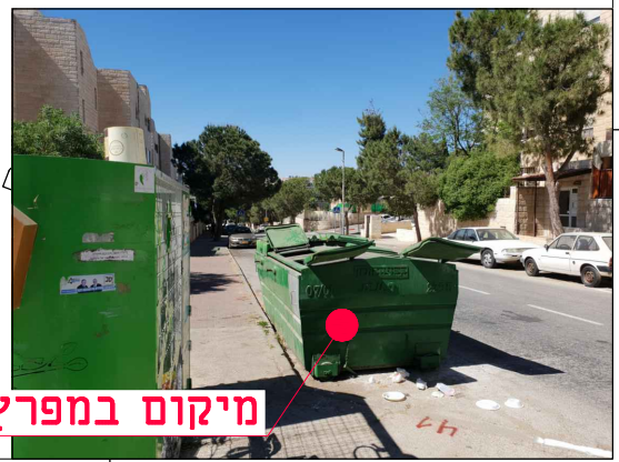
מיקום במפרץ חניה