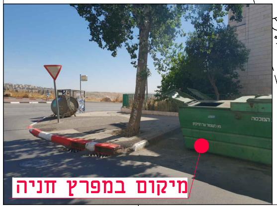
מיקום במפרץ חניה