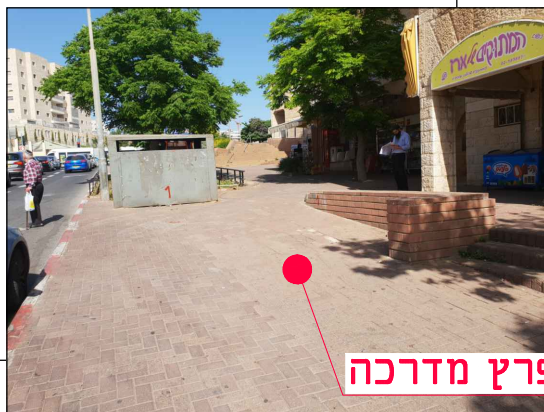
מיקום במפרץ מדרכה

מחזור גיליון שלב פרויקט אלמנט מקום תחום ספק MOR-BIN-JER-PISGATZEEV_B-FC-2001-00