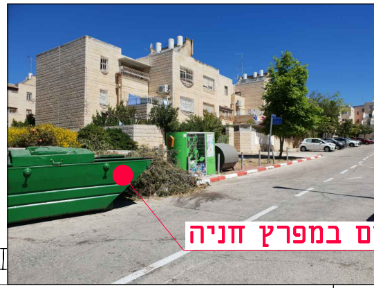
מיקום במפרץ חניה

הערות: • גבולות השיקום ייקבעו ע"י המפקח בשטח בשלב הביצוע, לאחר החפירה והצבת מעטפת הבסון. • אין לבצע עבי שיקום ללא קבלת הנחיות מפורטות לגבולות הביצוע. • ביצוע ע"פ חוברת פרטים סטנדרטיים וקביעת המפקח לסוג הפרט. עבור עבודות גמר בלבד. • ביצוע התקנת הפז על פי תכנון ביצוע הספק, התאמת כל המידות הנדרשות לביצוע הפז ולקבלת שיקום סופי בהתאם לפרט המתכנן - באחריות הספק.