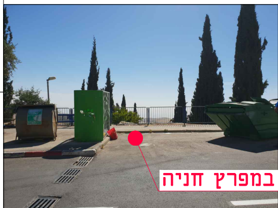
מיקום במפרץ חניה