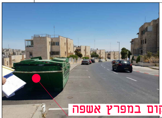
מיקום במפרץ אשפה

מחזור גיליון שלב פרויקט אלמנט מקום תחום ספק MOR-BIN-JER-PISGATZEEV_B-FC-2054-00