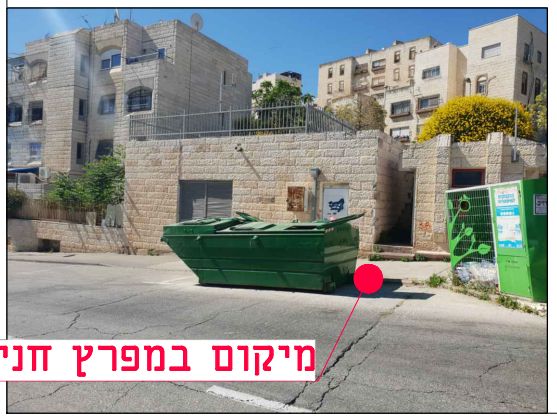
מיקום במפרץ חניה 8

הערות: • גבולות השיקום ייקבעו ע"י המפקח בשטח בשלב הביצוע, לאחר החפירה והצבת מעטפת הבטון. • אין לבצע עבי שיקום ללא קבלת הנחיות מפורטות לגבולות הביצוע. • ביצוע ע"פ חוברת פרטים סטנדרטיים וקביעת המפקח לסוג הפרט. עבור עבודות גמר בלבד. • ביצוע התקנת הפח על פי תכנון ביצוע הספק, התאמת כל המידות הנדרשות לביצוע הפח ולקבלת שיקום סופי בהתאם לפרט המתכנן - באחריות הספק.