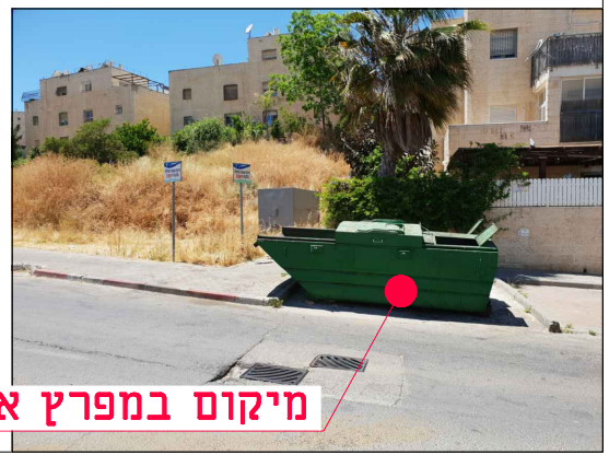
מיקום במפרץ אשפה