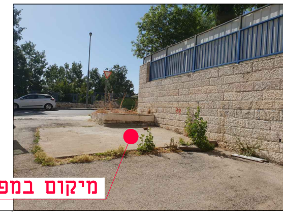
מיקום במפרץ אשפה

הערות: • גבולות השיקום ייקבעו ע"י המפקח בשטח בשלב הביצוע, לאחר החפירה והצבת מעטפת הבסון. • אין לבצע עבי שיקום ללא קבלת הנחיות מפורטות לגבולות הביצוע. • ביצוע ע"פ חוברת פרטים סטנדרטיים וקביעת המפקח לסוג הפרט. עבור עבודות גמר בלבד. • ביצוע התקנת הפח על פי תכנון ביצוע הספק, התאמת כל המידות הנדרשות לביצוע הפח ולקבלת שיקום סופי בהתאם לפרט המתכנן - באחריות הספק.