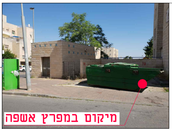
מיקום במפרץ אשפה

נושא השרטוט: תנוחה מס' תיק תאום: 806450 שם קובץ הגיבוי: MOR-BIN-JER-PISGATZEEV_B-FC-2XXX.DWG שם קובץ הדפסה: MOR-BIN-JER-PISGATZEEV_B-FC-2077-00.PLT מחזור: גיליון שלב פרויקט אלמנט מקום תחום ספק MOR-BIN-JER-PISGATZEEV_B-FC-2077-00