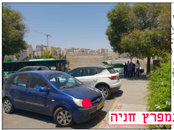
מיקום במפרץ חניה

מחזור: גיליון שלב פרויקט / אלמנט / מקום / תחום / ספק MOR-BIN-JER-PISGATZEEV_B-FC-2058-00