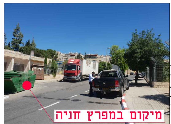
מיקום במפרץ חניה

מחזור גיליון שלב פרויקט אלמנט מקום תחום ספק MOR-BIN-JER-PISGATZEEV_B-FC-2048-00