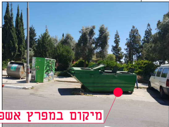
מיקום במפרץ אשפה

מרהורה גיליון שלב פרויקט אלמנט מקום תחום ספק MOR-BIN-JER-PISGATZEEV_B-FC-2047-00