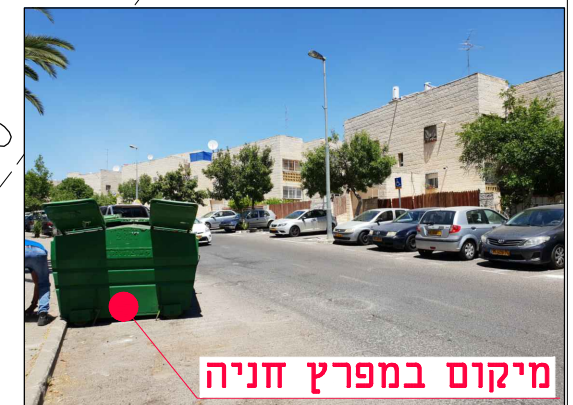
מיקום במפרץ חניה