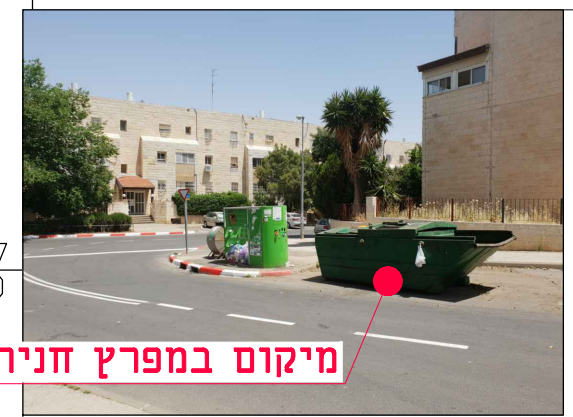
מיקום במפרץ חניה