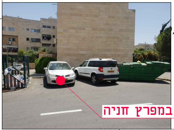
מיקום במפרץ חניה

הערות: • גבולות השיקום ייקבעו ע"י המפקח בשטח בשלב הביצוע, לאחר החפירה והצבת מעטפת הבטון. • אין לבצע עבי שיקום ללא קבלת הנחיות מפורטות לגבולות הביצוע. • ביצוע ע"פ חוברת פרטים סטנדרטיים וקביעת המפקח לסוג הפרט. עבור עבודות גמר בלבד. • ביצוע התקנת הפז על פי תכנון ביצוע הספק, התאמת כל המידות הנדרשות לביצוע הפז ולקבלת שיקום סופי בהתאם לפרט המתכנן - באחריות הספק.