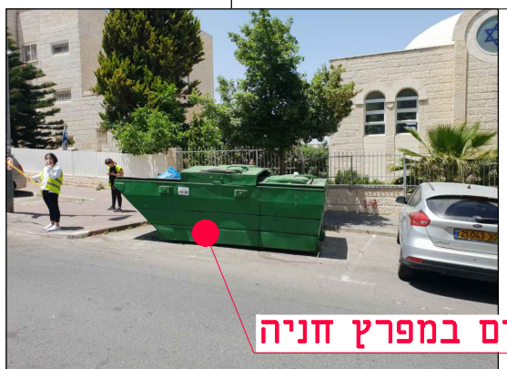
מיקום במפרץ חניה

מחזור: גיליון שלב פרויקט אלמנט מקום תחום ספק MOR-BIN-JER-PISGATZEEV_B-FC-2108-00