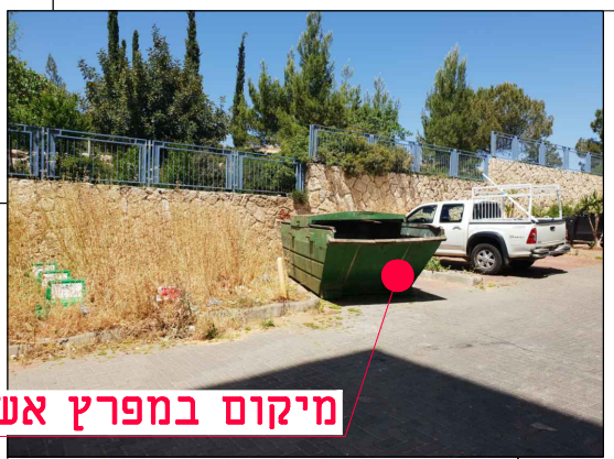
מיקום במפרץ אשפה

מחזור גיליון שלב פרויקט: אלמנט מקום תחום ספק MOR-BIN-JER-PISGATZEEV_B-FC-2056-00