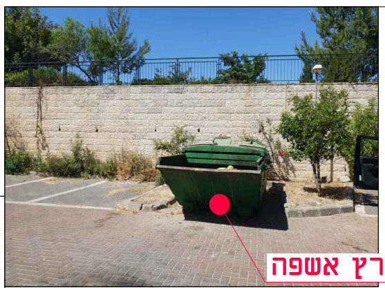
מיקום במפרץ אשפה