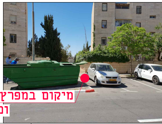
מיקום במפרץ חניה ומדרכה

הערות: • גבולות השיקום ייקבעו ע"י המפקח בשטח בשלב הביצוע, לאחר החפירה והצבת מעטפת הבסון. • אין לבצע עבי שיקום ללא קבלת הנחיות מפורטות לגבולות הביצוע. • ביצוע ע"פ חוברת פרטים סטנדרטיים וקביעת המפקח לסוג הפרט. • עבור עבודות גמר בלבד. • ביצוע התקנת הפז על פי תכנון ביצוע הספק, התאמת כל המידות הנדרשות לביצוע הפז ולקבלת שיקום סופי בהתאם לפרט המתכנן - באחריות הספק.