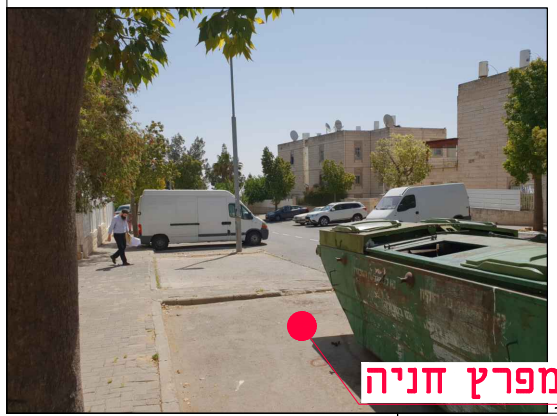
מיקום במפרץ חניה

הערות: • גבולות השיקום ייקבעו ע"י המפקח בשטח בשלב הביצוע, לאחר החפירה והצבת מעטפת הבטון. • אין לבצע עבי שיקום ללא קבלת הנחיות מפורטות לגבולות הביצוע. • ביצוע ע"פ חוברת פרטים סטנדרטיים וקביעת המפקח לסוג הפרט. עבור עבודות גמר בלבד. • ביצוע התקנת הפח על פי תכנון ביצוע הספק, התאמת כל המידות הנדרשות לביצוע הפח ולקבלת שיקום סופי בהתאם לפרט המתכנן - באחריות הספק.