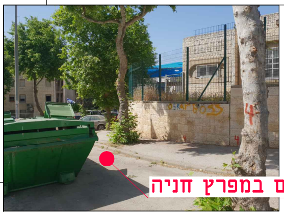
מיקום במפרץ חניה

מחזור גיליון שלב פרויקט אלמנט מקום תחום ספק MOR-BIN-JER-PISGATZEEV_B-FC-2004-00