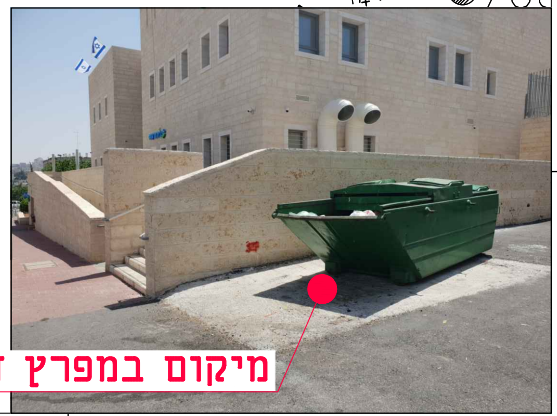
מיקום במפרץ חניה