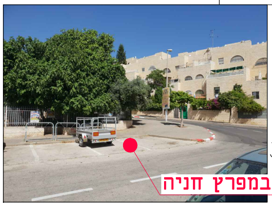
מיקום במפרץ חניה

מחזור גיליון שלב פרויקט אלמנט מקום תחום ספק MOR-BIN-JER-PISGATZEEV_B-FC-2116-00