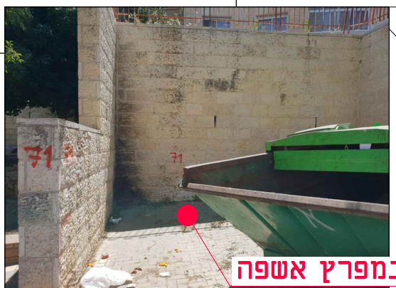
מיקום במפרץ אשפה

שם קובץ הגיבוי: MOR-BIN-JER-PISGATZEEV_B-FC-2XXX.DWG שם קובץ הדפסה: MOR-BIN-JER-PISGATZEEV_B-FC-2071-00.PLT מהדורה גיליון שלב פרויקט אלמנט מקום תחום ספק MOR-BIN-JER-PISGATZEEV_B-FC-2071-00