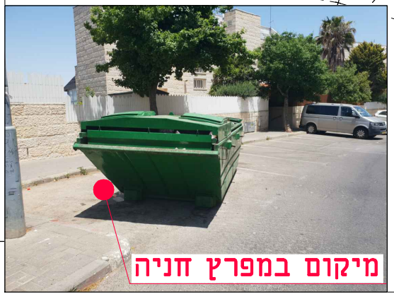
מיקום במפרץ חניה