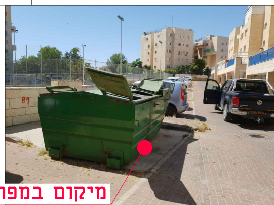
מיקום במפרץ אשפה