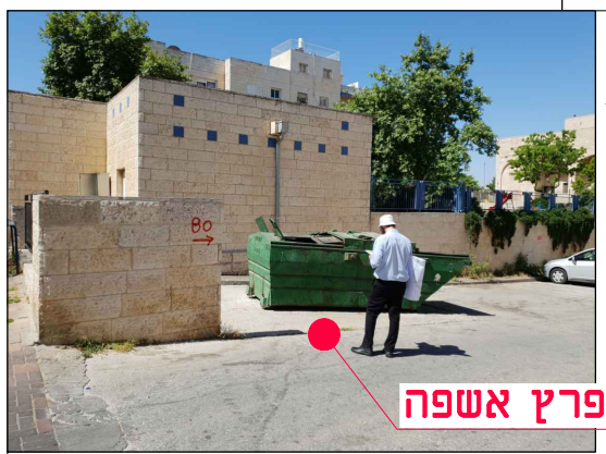
מיקום במפרץ אשפה

מחזור גיליון שלב פרויקט אלמנט מקום תחום ספק MOR-BIN-JER-PISGATZEEV_B-FC-2080-00